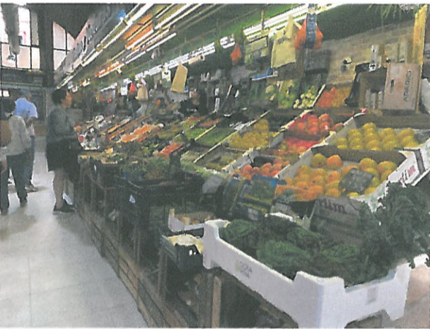
Modelos diversos de mercados de tipología alimentaria.