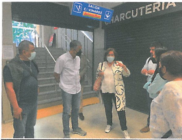
Presentación e introducción en campo por la Directora General de Comercio del Ayuntamiento de Madrid.