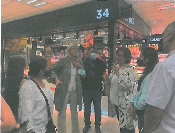
Participación de ciudades asociadas San José, México y Guatemala.