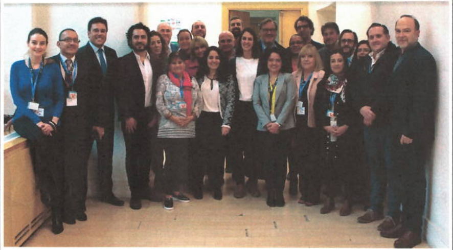
Foto de familia, Directores de Cooperación Internacional y Coordinadores UCCI