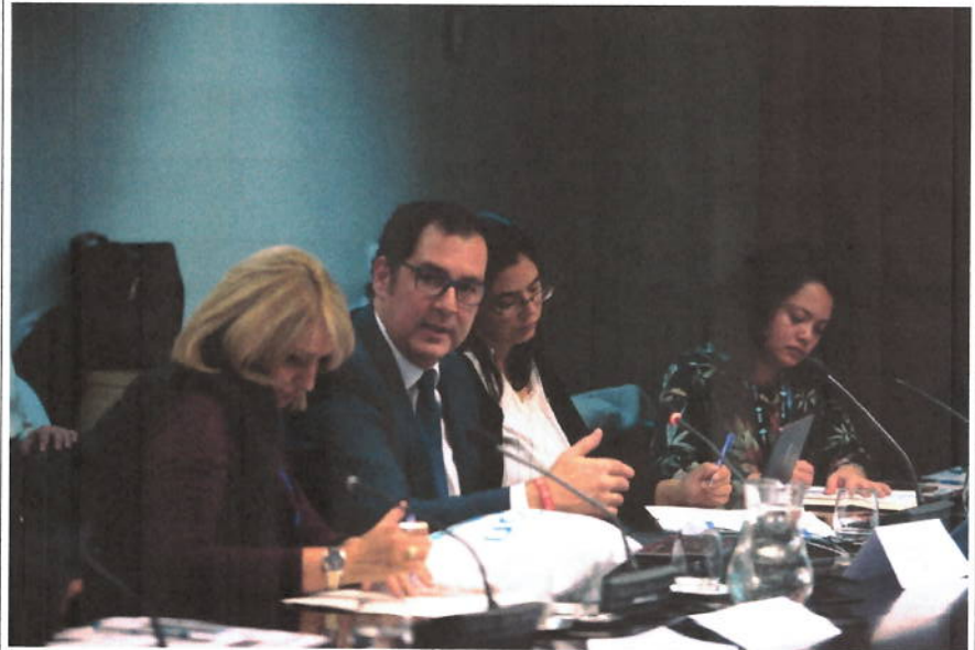
Representante de Unión Internacional de Transporte Público (UITP)

JUEVES Patio de Cristales (Plaza de la Villa, Madrid)