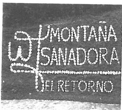
Fuente: Montaña Sanadora en el Corregimiento de San Sebastián de Palmitas