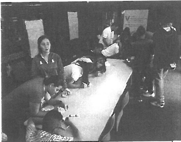
Fuente: Trabajo en equipos en el Taller Turismo Rural Comunitario

Esta actividad según sus palabras se conoce desde los años 70's y se presenta como una alternativa de solución de la crisis agraria que se ha presentado en México como en todo el país latinoamericano. Al respecto plantea la importancia de hacer prevalecer la actividad agraria, ya que de acuerdo con lo que expresa "el campo hace parte de la independencia de los pueblos".