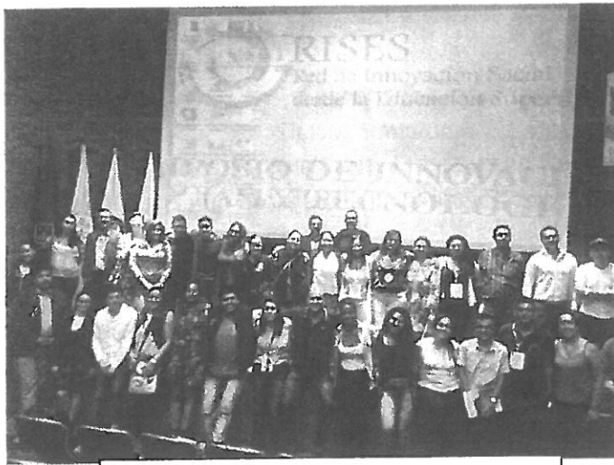
Fuente: Firma de Pacto de Redes de Colaboración