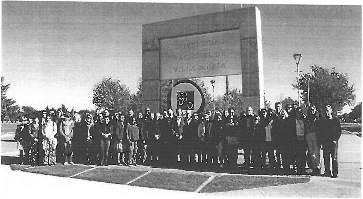
Delegación de 40 municipalidades de América Latina y el Caribe.